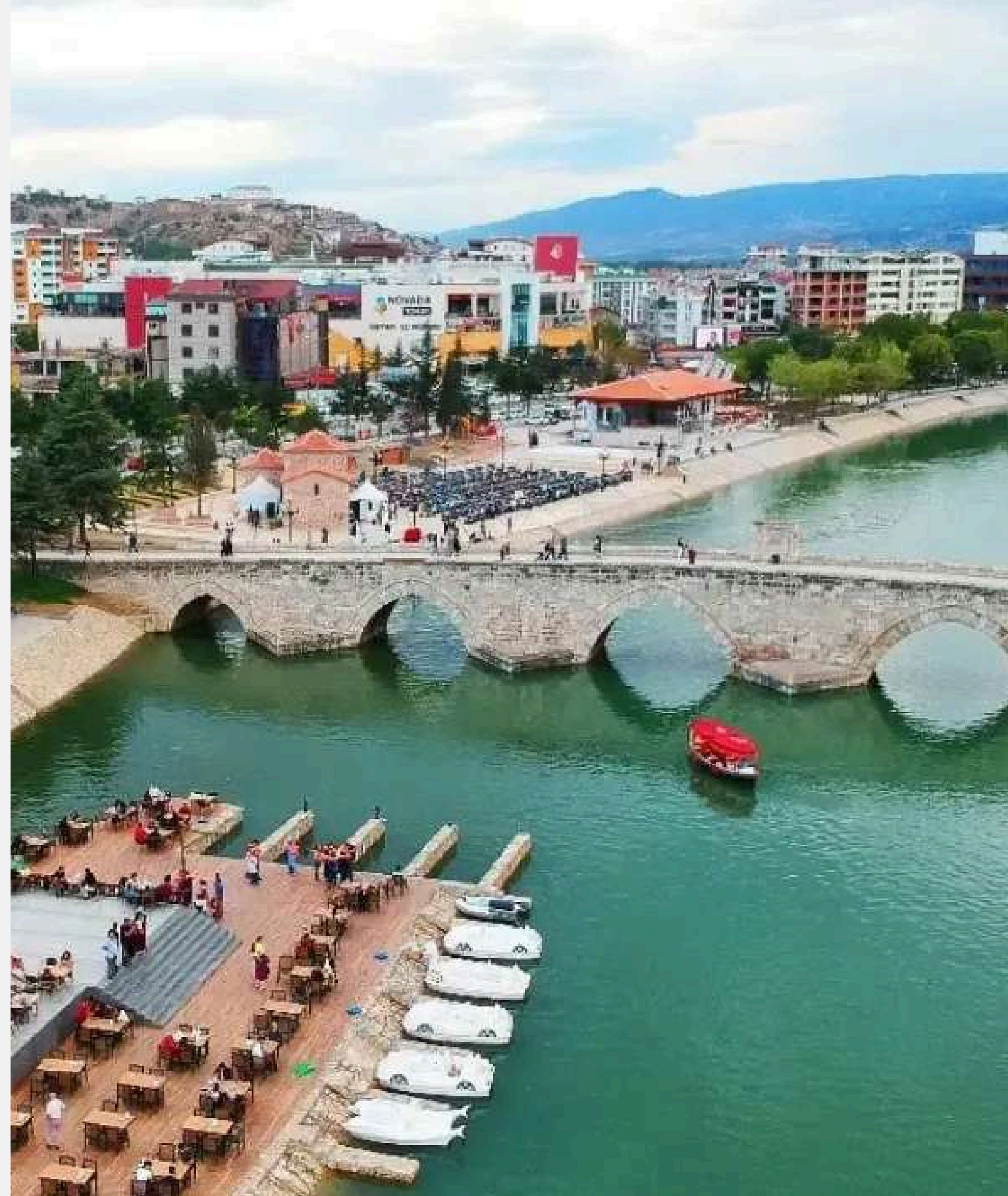
TAŞ KÖPRÜ (HIDIRLIK KÖPRÜSÜ) - TOKAT