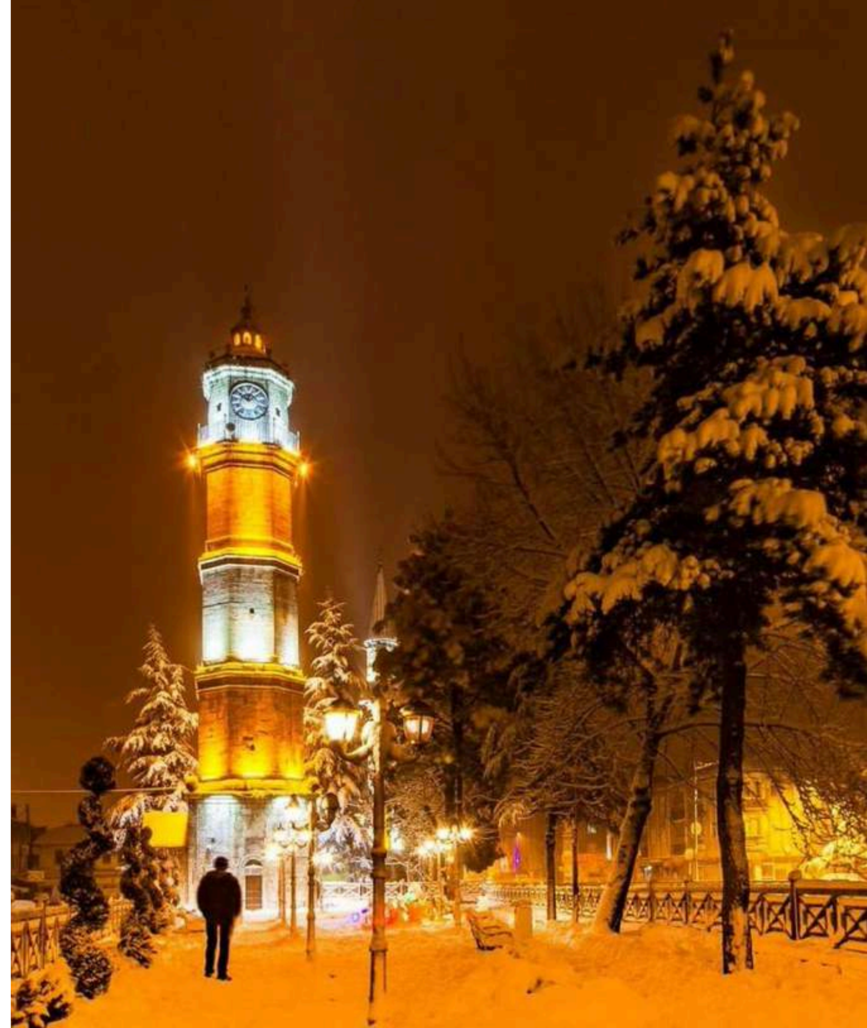
SAAT KULESİ - TOKAT

7-14 Ocak Beyaz Baston Görme Engelliler Haftası