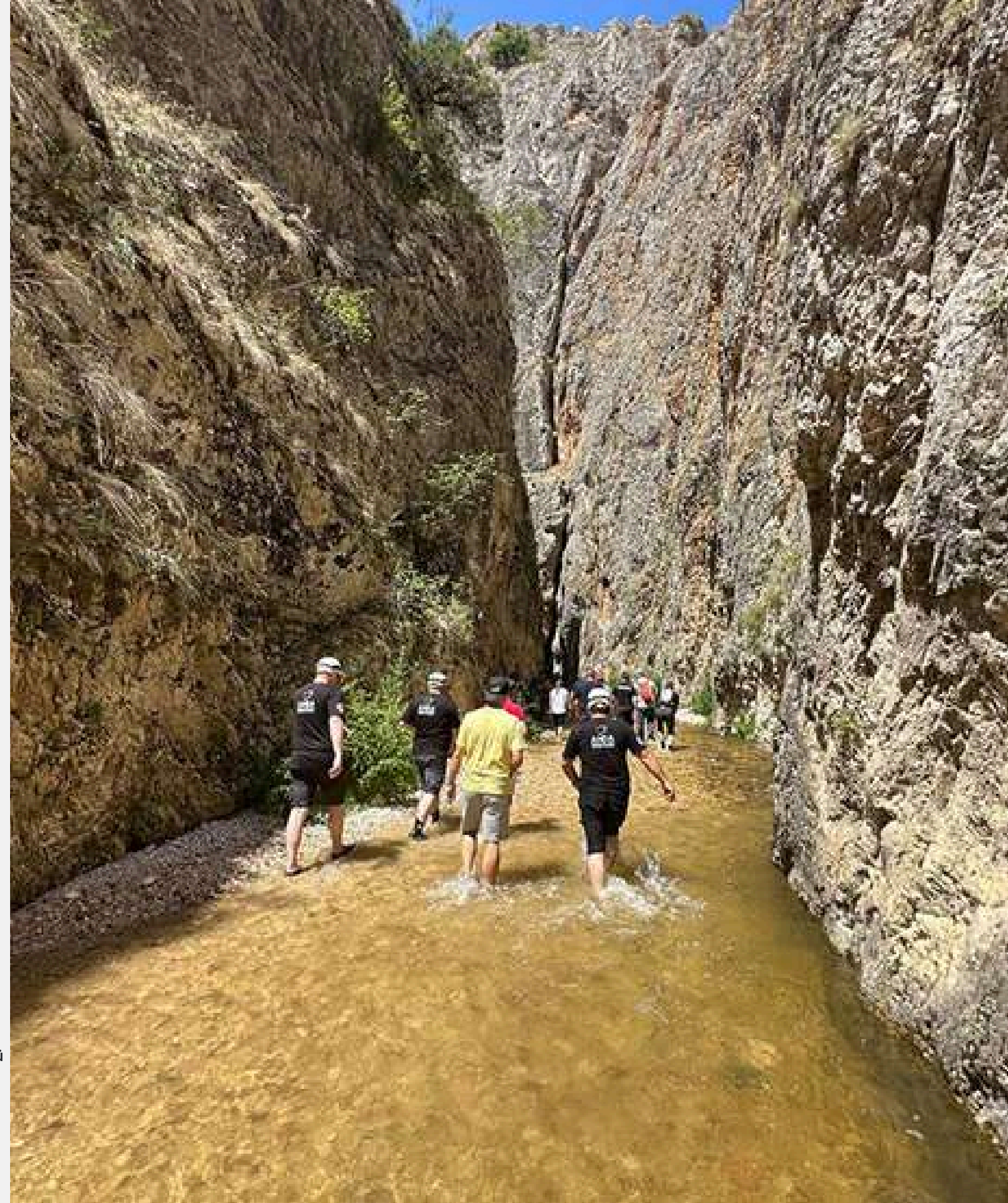
ZİNAV KANYONU - REŞADİYE