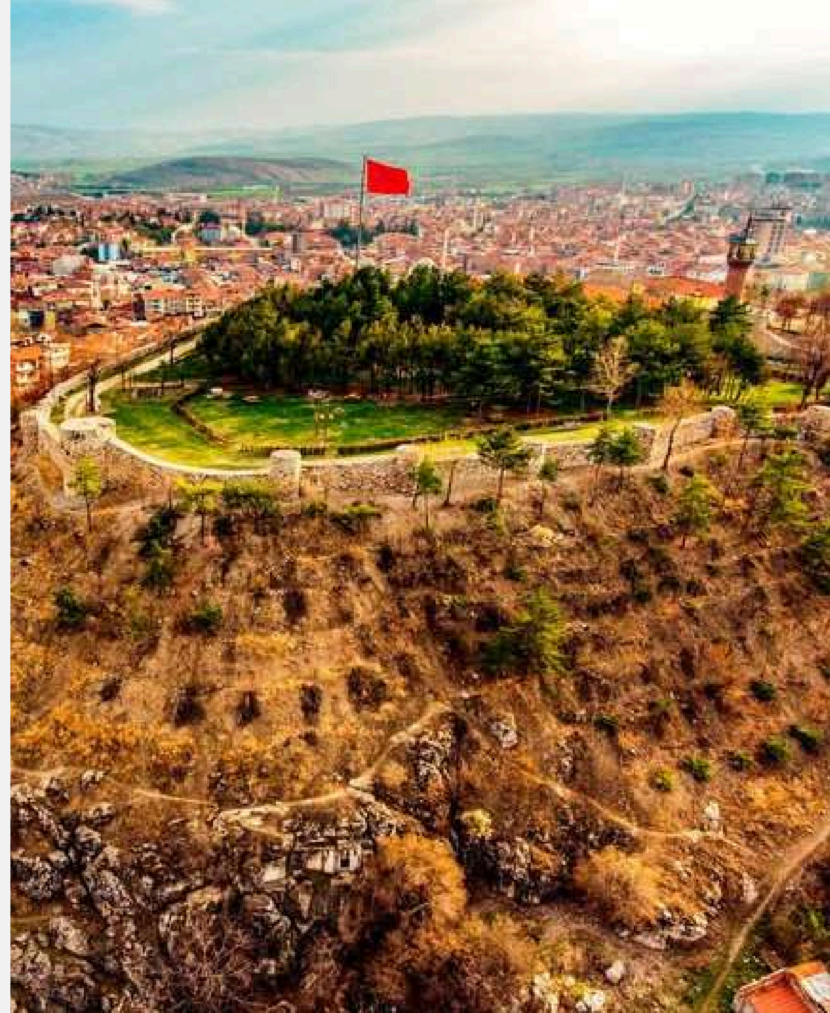
ZİLE KALESİ - ZİLE