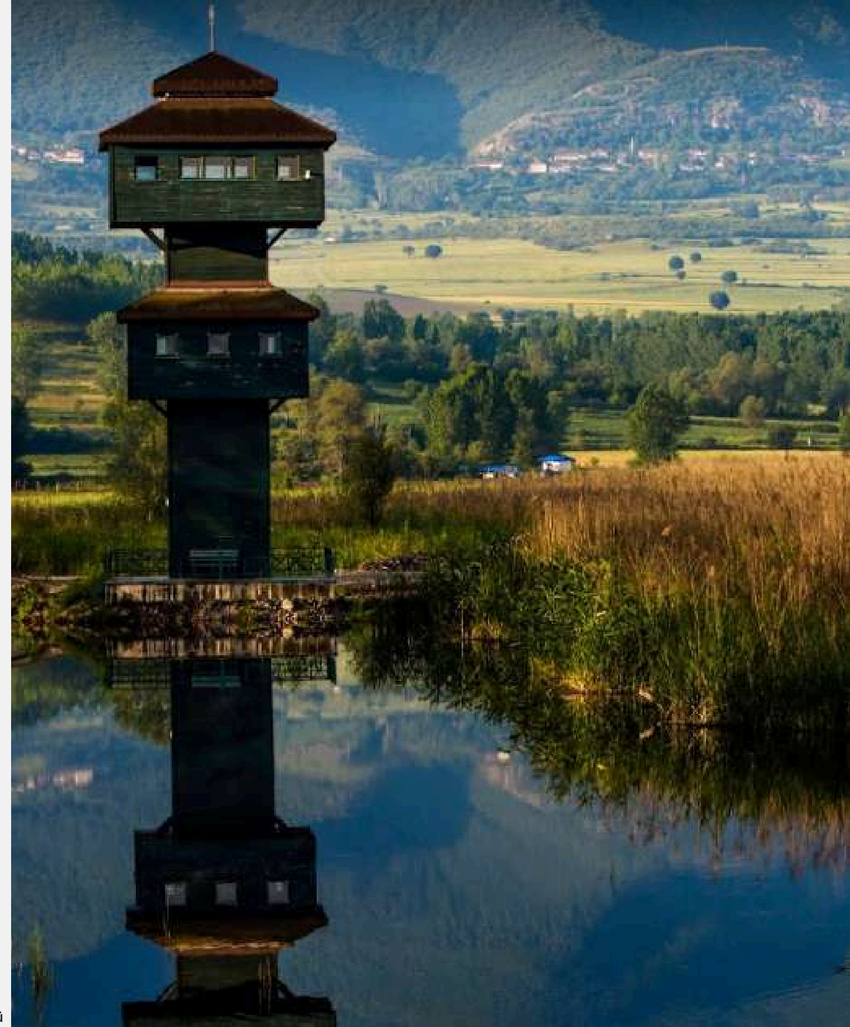
KAZ GÖLÜ - PAZAR

26 Haziran Dünya Uyuşturucu Kullanımı ve Kaçakçılığı ile Mücadele Günü