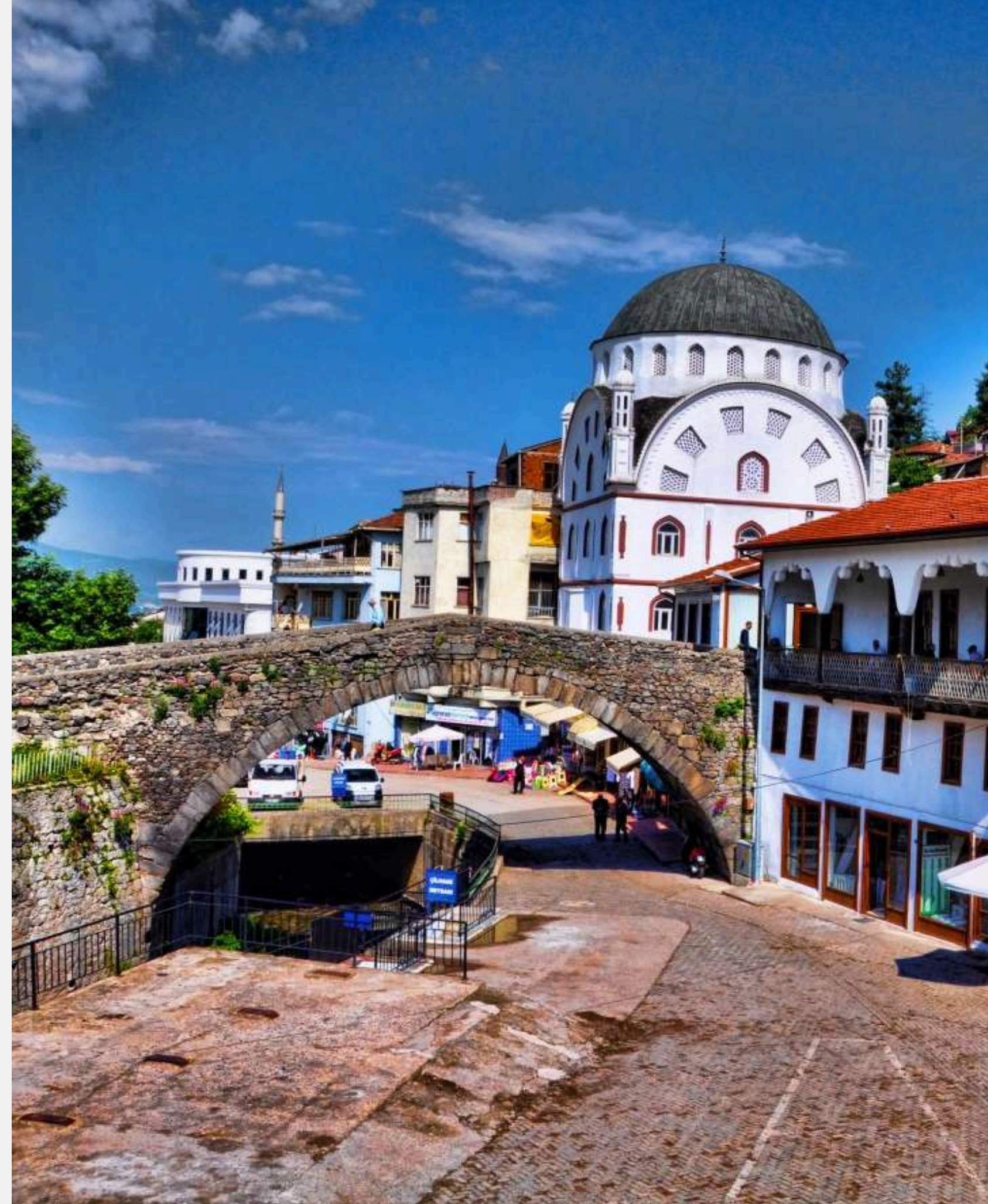
LEYLEKLİ (YILANLI) KÖPRÜ - NİK SAR